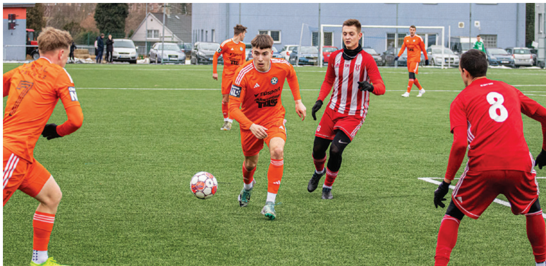
FK Varnsdorf je v přípravě zatím stoprocentní. Zápas porazil vysoko 5:0

Jak viděl výkony ve všech třech zápasech? Co je potřeba zlepšit? „Bylo vidět, že když hrajeme ak-