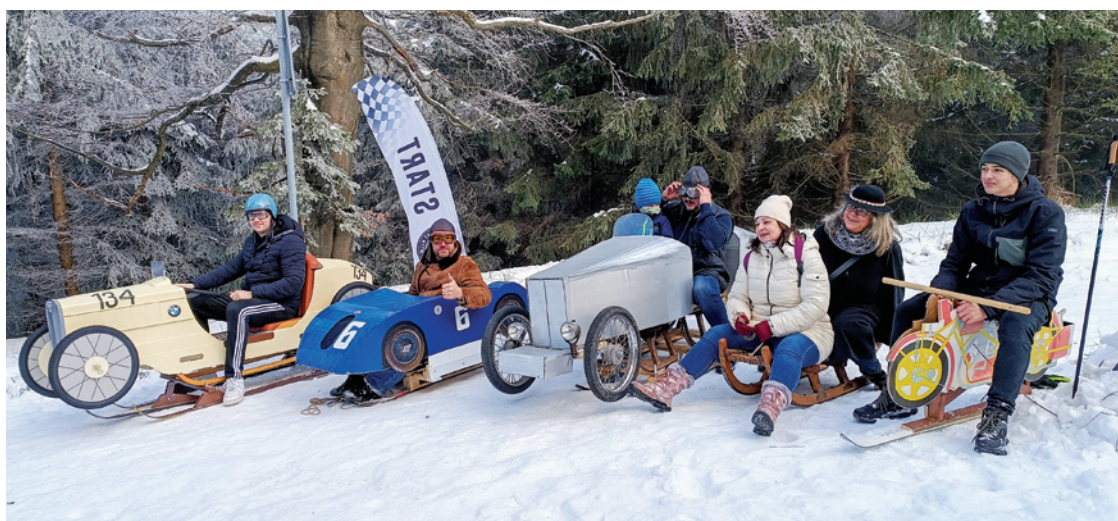
Třetí ročník závodu přilákal na start opravdu zajímavé kousky; foto SKM

Jelikož letos byly podmínky tratě a počasí naprosto ideální, pořadatelé závodů se dohodli s pilo-