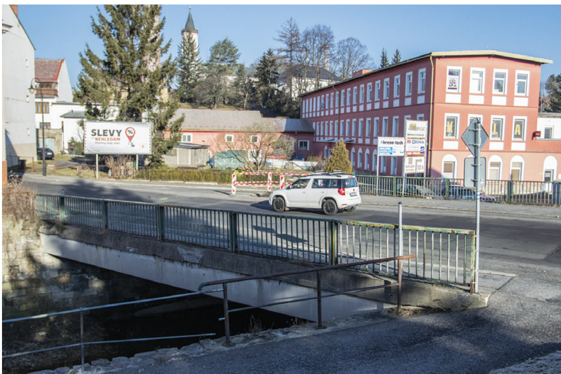
Rekonstrukce mostu v Národní ulici přinese dopravní omezení

V první fázi došlo k odfrézování asfaltového povrchu, poté bude