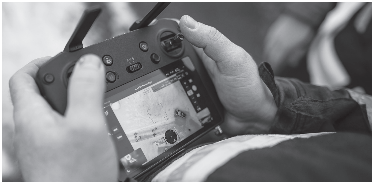
Do pátrací akce se zapojil i dron

Varnsdorf ■ Rozsáhlou pátrací akci spustila osoba, která v sobotu 18. ledna brzy ráno opustila hotel v Doubici a nebyla k nalezení. Do hledání se zapojili i varnsdorfští hasiči.