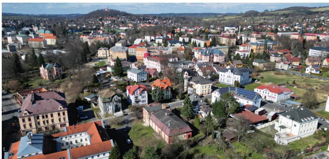
Počasí v roce 2024 přineslo několik zajímavých jevů. Na snímku pohled na město