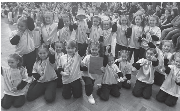
Tanečníci z Varnsdorfu uspěli ve Cvikově a přivezli bronzové medaile