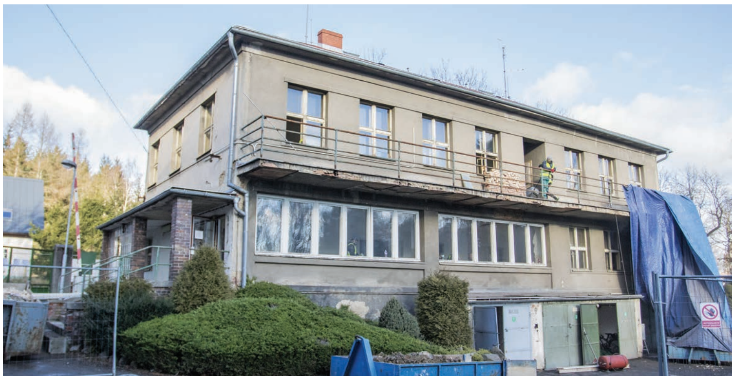
Varnsdorf se pustil do nákladné rekonstrukce administrativní budovy nemocnice

Varnsdorf ■ V areálu místní nemocnice je rušno. Začala totiž nejnákladnější investiční akce letošního roku, kterou je rekonstrukce administrativní budovy s vrátnicí a garážemi pro sanitní vozy.