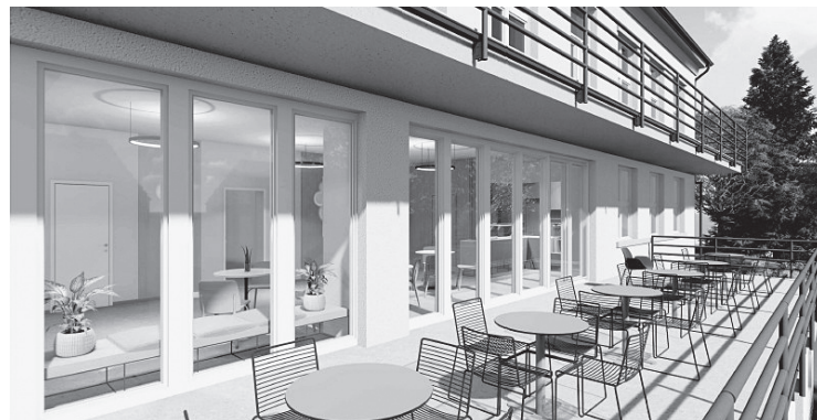
Vizualizace budoucí terasy s posezením; autor projekční ateliér FORWOOD