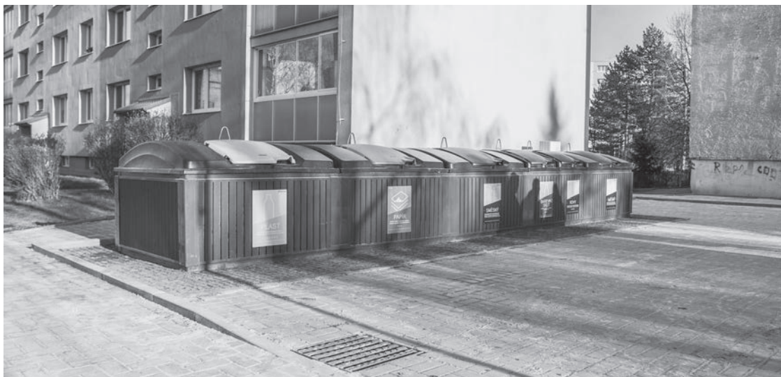
Nevzhledné kontejnery v Pražské ulici nahradily polopodzemní nádoby

I přesto je ale častým jevem, že přesně takový odpad je postavený u kontejnerů na sídlištích. Nejpalčivějším místem byla lokalita v Pražské ulici. Denně byly kontejnery plné nejrůznějšího odpadu