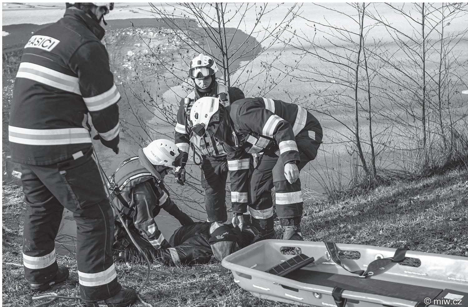
Záchrana osoby probořené v ledu byla tématem cvičení varnsdorfských hasičů

Varnsdorf ■ Podnapilá osoba se topí v rybníčku na Gerhusce. Takové hlášení se ozvalo na stanici profesionálních hasičů z Varnsdorfu v pondělí 30. prosince dopoledne. O tom, že se jedná o cvičení, hasiči předem nevěděli.