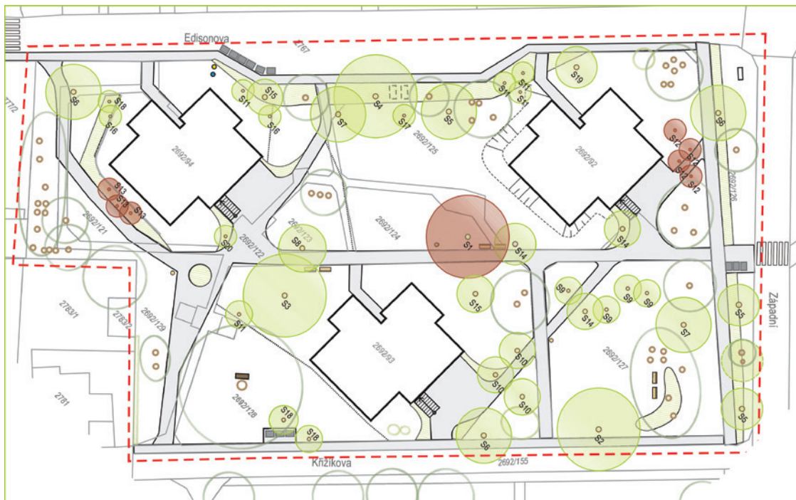
Prostranství u panelových domů mezi ulicemi Edisonova a Křížikova doplní desítky stromů a keřů

Bude vysázeno celkem čtyřicet pět stromů různých druhů a kultivarů. Nebudou chybět dub, buk, lípa, javory, okrasné třešně či jabloně. Výčet bude zkrátka rozmanitý. Celý prostor doplní zácliva a záhony podél chodníků. Na nich budou vysázeny stovky rostlin