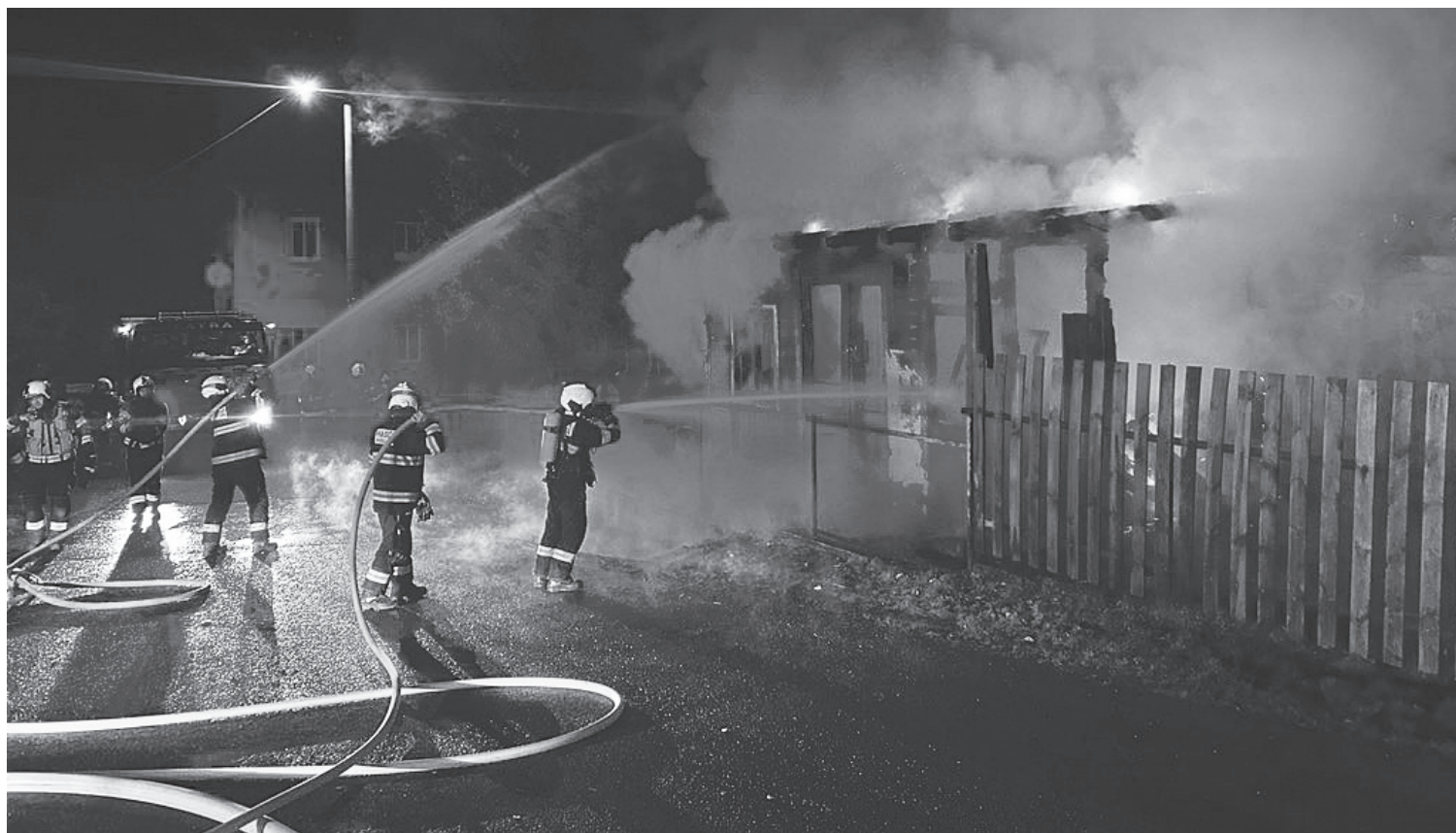
Hasiči vyjžděli do Krásné Lípy, hořela přístavba rodinného domu

Krásná Lípa ■ K rannímu požáru přístavby rodinného domu v Krásné Lípě vyjely v neděli 24. března jednotky z druhého stupně požárního poplachu. Na místo události byly povolány krátce po čtvrté hodině ranní.