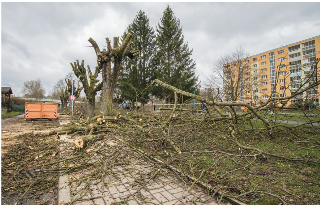
Tomáš Secký Kaštanová alej v Husově ulici prošla ošetřením; foto Tomáš Secký

Podobnou péči čeká také kaštanová alej v ulici Československých letců. Vzhledem k tomu, že jde o krajskou komunikaci, bude údržbu řídit a financovat Správa a údržba silnic Ústeckého kraje.