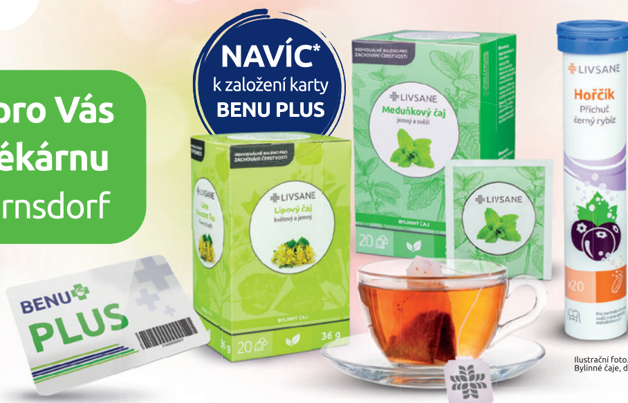
Ilustrační foto. Bylinné čaje, doplňky stravy.

*K Vaší osobní registraci jako nového člena věrnostního programu BENU PLUS v nové otevřené BENU Lékárně na adrese Pražská 2951, Varnsdorf 40747 („Lékárna“) získáte jeden z vybraných produktů LIVSANE (vybrané produkty: LIVSANE Čaj lipový 20 sáčků – bylinný čaj, LIVSANE Čaj meduňkový 20 sáčků – bylinný čaj, LIVSANE Šumivé tablety CZ Hořčík černý rybič 20 ks – doplněk stravy) dle Vaší volby z jejich dostupné nabídky navíc pouze za 0,01 Kč („Akční nabídka“). Vybrané produkty LIVSANE zahrnuté do Akční nabídky jsou bylinné čaje nebo doplňky stravy. Doplňky stravy nenahrazují pestrou a vyváženou stravu ani zdravý životní styl. Nepřekračujte jejich doporučené denní dávkování a uchovávejte je mimo dosah dětí. Akční nabídka platí pouze od otevření lékárny do 15. 5. 2024 nebo do vyprodání zásob. Akční nabídky nelze využít v jiných kamenných BENU Lékárnách ani na e-shopech, stejně tak ji nelze využít opakovaně. Nárok z Akční nabídky nelze sménit za hotovost nebo jakékoliv jiné zboží či nárok na poskytnutí jakékoliv služby. Akční nabídky rovněž nelze využít v kombinaci s jinými akčními nabídkami či slevami. Pozdější změny a tiskové chyby jsou vyhrazeny.