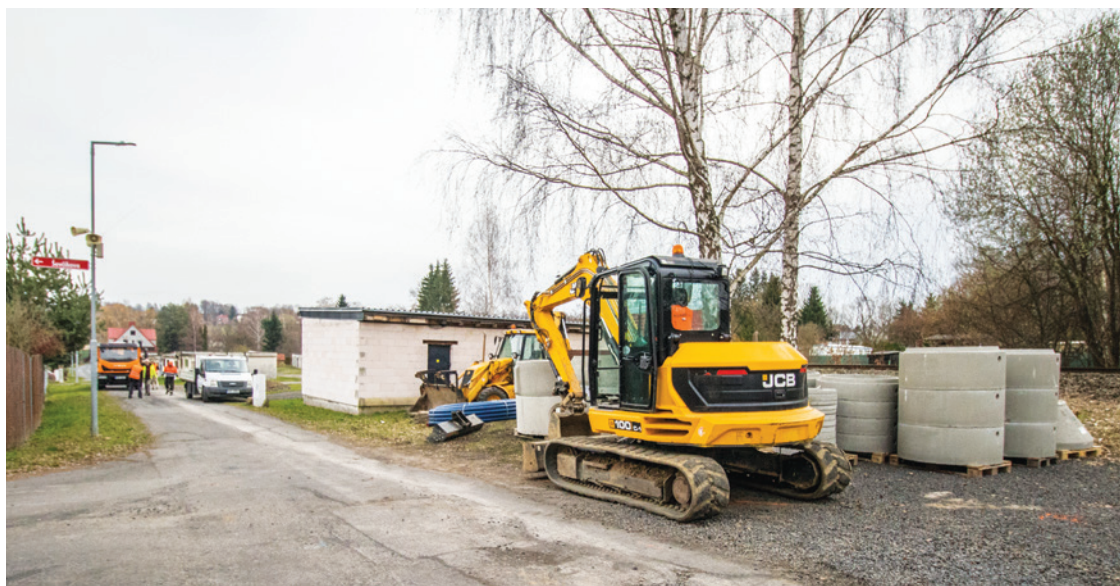
SVS zahájila další investiční akci ve Varnsdorfu. Rekonstrukcí prochází vodovod i kanalizace

V Železné ulici se nachází také litinový vodovodní řád, který vykazuje inkrustaci. Do provozu byl uveden v roce 1898. Dále se stavební práce dotknou také kanalizační stoky z roku 1990. I tady