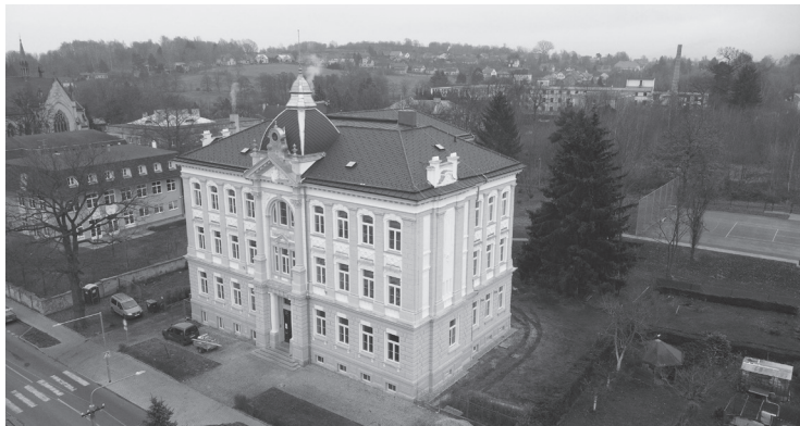
IZŠ Karlova nabízí možnost předškolního vzdělávání v přípravné třídě

Ve třídě pracují tak trochu jako ve škole, a tak trochu jako ve školce. Během dopoledních hodin se hravým a zajímavým způsobem připravují na školu. Přípravná třída je určena pro děti s odkladem školní docházky a pro děti v posledním roce před zahájením povinné školní docházky. Pokud vaše dítě dostalo odklad školní docházky, nebo máte pocit, že vaše dítě není dostatečně zralé na školu, pak je tu pro vás, ale hlavně pro