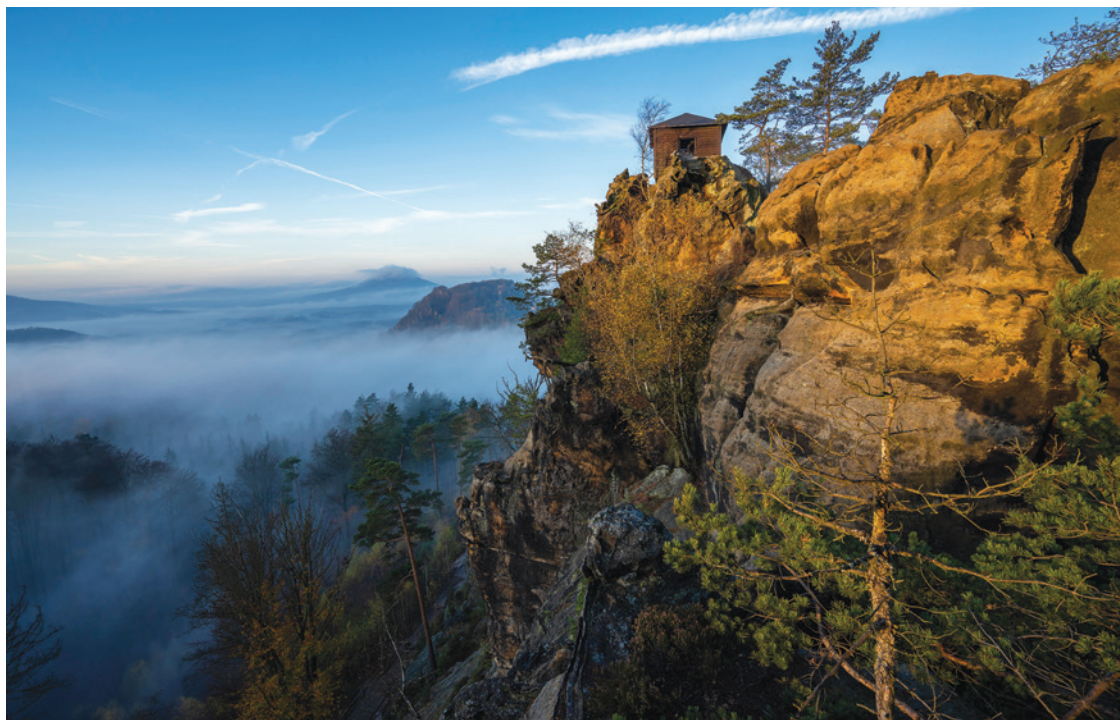
Rudolfův kámen v Národním parku České Švýcarsko.

Rozsáhlá cestní síť připravená pro turistickou sezónu 2024 je výsledkem zásahů, které správa národního parku realizovala v terénu během uplynulého roku. O cesty na území národního parku pečuje na základě harmonogramu, který místním starostům a dalším zástupcům regionu představila v únoru loňského roku.