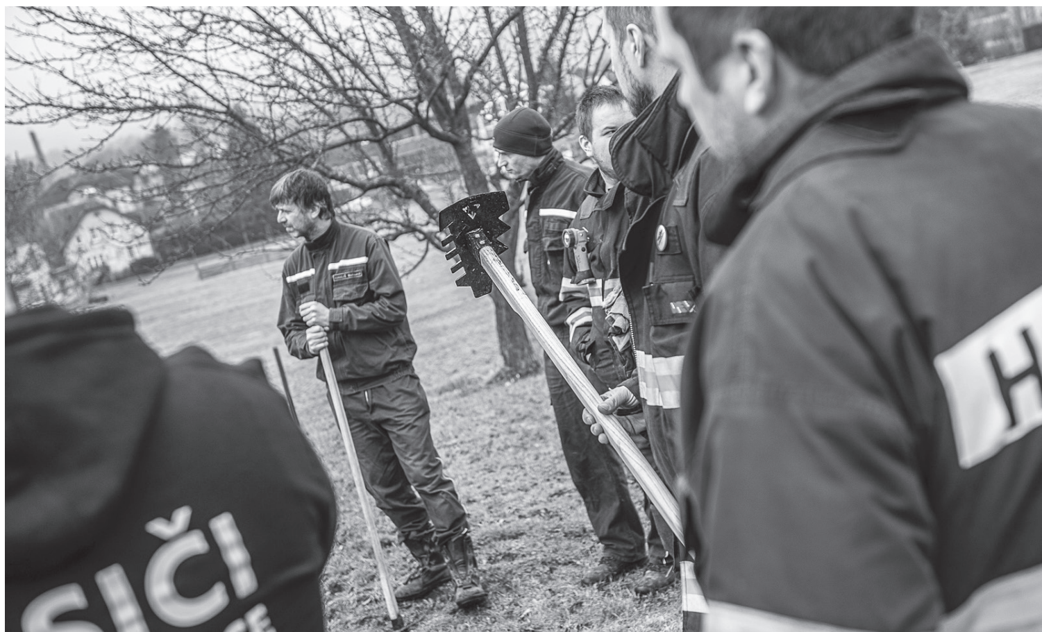
Hasiči Varnsdorf prezentovali v Mikulášovicích tzv. „D program“

Varnsdorf ■ Příspěvky od varnsdorfských hasičů z poslední doby jistě napověděly, že nalezli zalíbení v tzv. „D programu“, což je velmi zjednodušeně řečeno snaha o efektivní práci s hasební vodou (té není nikdy dost), méně námahy pro zasahující hasiče, méně způsobených škod při hasebních pracích a tak dále.