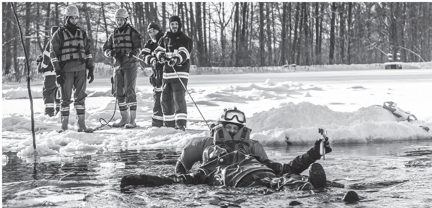
Varnsdorfští dobrovolní hasiči cvičili záchranu osob z ledu

Varnsdorf ■ Členové dobrovolné jednotky přijali v neděli 21. ledna od rumburských kolegů pozvání na ledový výcvik na rybníku Racek v Rumburku.