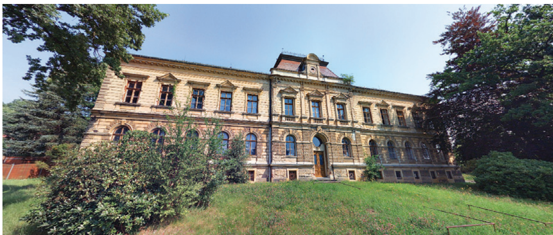
Město objekt koupilo od Římskokatolické farnosti za téměř šest milionů korun. Využití pro ni zatím nemá

Již císařský patent Josefa II. z roku 1784 ukládal obcím péči o choré. V rámci svých reforem rušil kláštery a z nich vytvářel „zdravotnicko-sociální“ zařízení s názvy sirotčinec, chorobinec, chudobinec či obecní dvůr. Zřizování těchto institucí většinou iniciovali a také finančně podporovali míst-