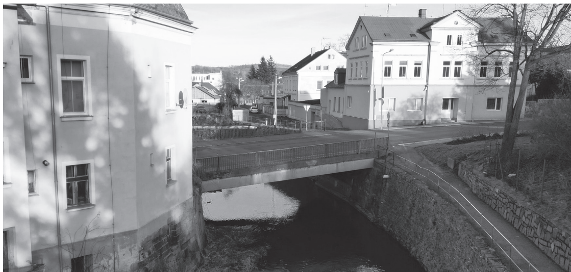
Velkou akcí letošního roku bude nový most v Národní ulici

Část finančních prostředků půjde i do objektů města. V Klubu Pohádka se chystá realizace nového plynového topení, rekonstrukci čeká i plynová kotelna v budově gymnázia. Kulturní dům Střelnice se sice v roce 2024 nedočká své celkové rekonstrukce, na kterou město hledá vhodný dotační titul, ale po nedávné rekonstrukci plynové kotelny se dočká i nové elektrické přípojky. Aktuálně město řeší také havarijný stav střechy a terasy, který těsně koncem roku nastal v objektu knihovny a na služebně městské policie. V oblasti bytové výstavby je naplánováno zateplení fasády a lodžii u posledního městského panelového domu v ulici Karolíny Světlé č. p. 3014. Své důstojné