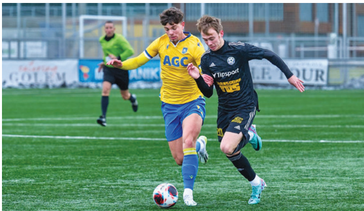
FK Varnsdorf v zimní lize porazil rezervu Teplic 2:0

Jeho svěřenci navíc poprvé v zimní přípravě neskórovali. „Mrzí mě, že jsme se neprosadili v koncovce, možnosti jsme určitě měli. Možná jsme měli kopat penaltu, ale to už je jedno,“ konstatoval.