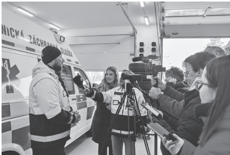
Rumburští záchranáři převzali novou přístavbu výjezdové základny

„Celkové investiční náklady přesáhly 23,4 milionu korun včetně DPH. Stavba trvala přesně jeden rok, od srpna 2022 do srp-