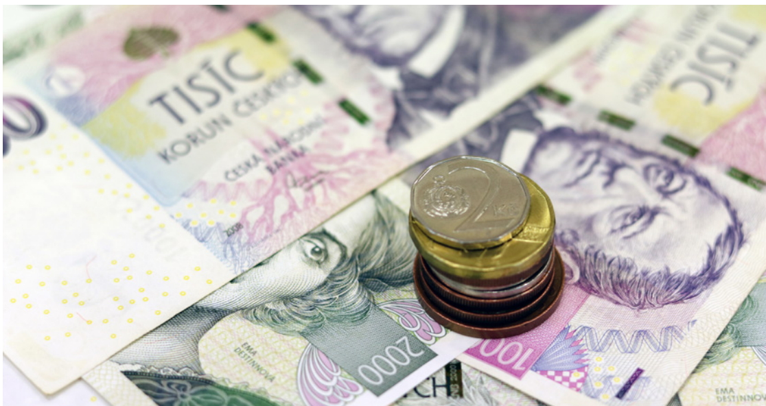
Varnsdorfský rozpočet je rekordní, hospodařit se bude s více než půlmiliardou

V roce 2023 patřilo ke stěžejním úkolům dokončit dvě náročné investiční akce, které přecházely rozpočty města několik let. Řeč je o výstavbě nové mateřské školy v Západní ulici a rekonstrukci ubytovny v ulici T. G. Masaryka. Oba objekty budou předány do užívání v prvním čtvrtletí roku. Největší a také nejnáročnější