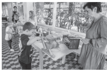
Děti si zkusily mlít obiloviny

Mateřská škola v Pražské ulici, které nikdo neřekne jinak než Zahrádka, je od roku 2015 zapojena do programu Skutečně zdravá škola. Co to znamená? Příprava jídel je sezónní, z čerstvých, často