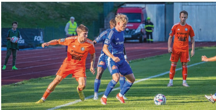
Fotbalisté Varnsdorfu ztratili dobře rozehraný zápas s Olomoucí

„Náš vstup do utkání byl hodně špatný. Za mě jsme patnáct minut nepochopitelně nevěděli, jakým způsobem se máme prosadit. Ten inkasovaný gól nás dostal do kolen. Od 20. minuty jsme hru vyrovnali a měli tam tři, čtyři situace z křídelného prostoru, které jsme nevyřešili. Ve druhém poločase jsme byli aktivnější než Chrudim, která se koncentrovala na obrannou fázi a chodila do naší otevřené obrany. Měli jsme tam hodně centrů a dvě, tři situace, kdy jsme mohli dát gól. Hosty podržel brankář. Chybělo nám tam štěstíčko nebo dobře odražený míč. Hosté nám pak dali krásnou druhou branku a po brejku třetí. Přes porážku tam byla od našich hráčů vidět snaha. Je ale vidět, že nemáme finální řešení. Musíme na tom dál pracovat,“ řekl Ivan