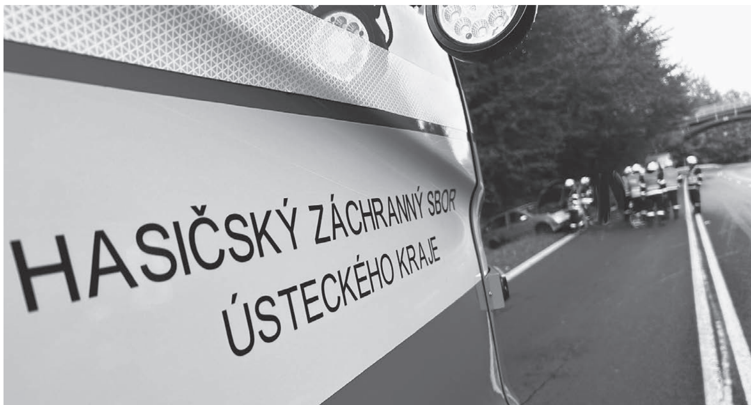
Ilustrační foto. Varnsdorfsí hasiči zasahovali během jednoho týdne u několika různých událostí

Varnsdorf ■ Profesionální i dobrovolní hasiči zažili týden plný výjezdů k nejrůznějším událostem.