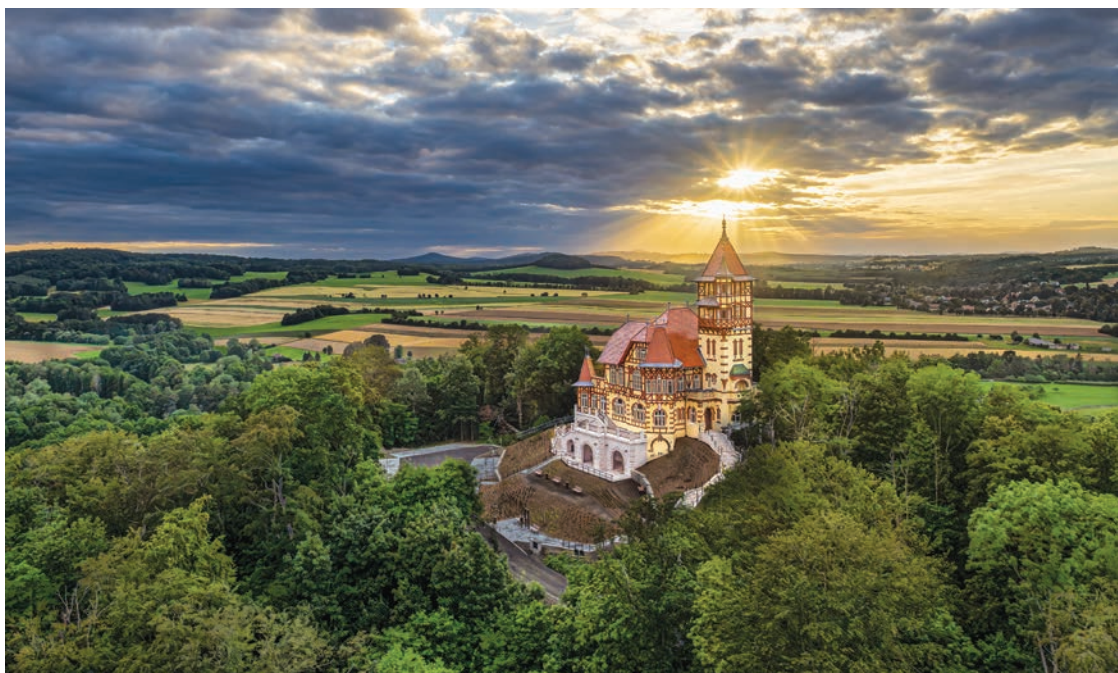
Slavnostní znovuotevření Hrádku zhatilo počasí, turistům se tak otevřela alespoň vyhlídková věž; foto Ilona Rosenkrancová

Zatímco zbytek republiky sužovaly záplavy, situace ve Varnsdorfu naštěstí nebyla nikterak vážná. Kromě chladného počasí a silného větru se vyplnila pověst o „modrém kameni“, který chrání město před přírodními živly. Mandava dosáhla prvního povodňového stupně pouze v sobotu, a to jen na několik hodin, kdy hladina vystoupala na maxi-