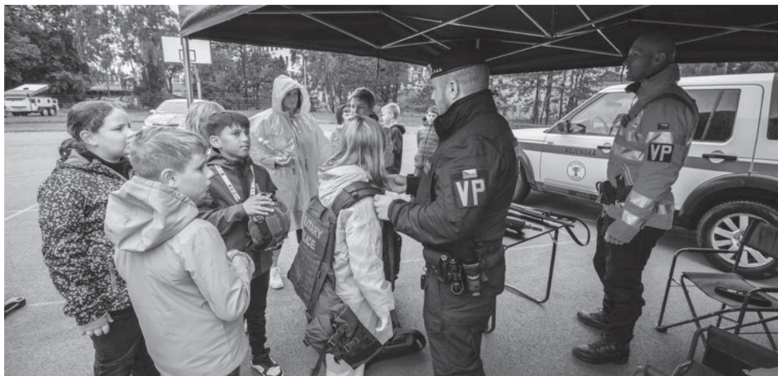
Areál za sportovní halou v Západní ulici hostil další ročník Dne s IZS

Akce byla skvělou příležitostí seznámit se nejen s technikou jednotlivých složek, ale hlavně