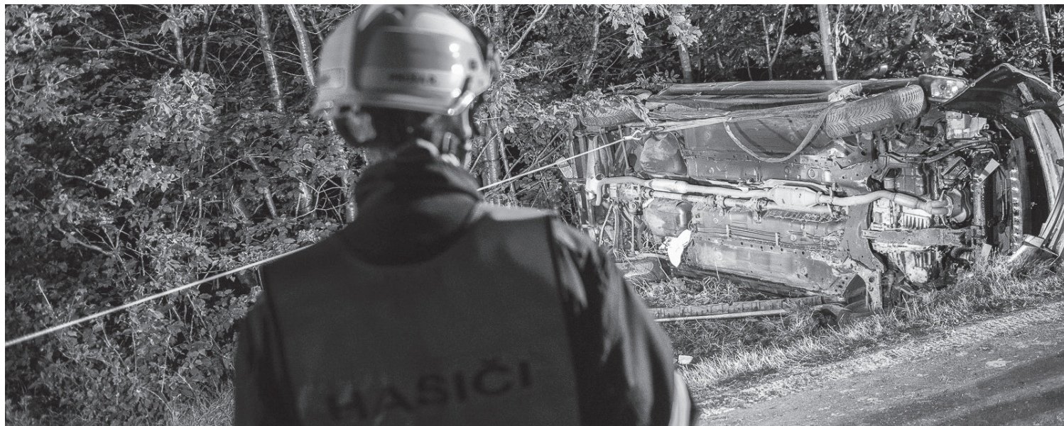
Auto na Studánce skončilo na boku mimo vozovku

Varnsdorf ■ K dopravní nehodě na silnici 265 vedoucí na Studánku vyjela profesionální jednotka hasičů v úterý 10. září. V zatáčce nad vodárnou skončil osobní automobil na boku.