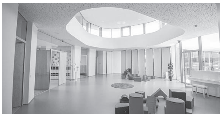
Objekt mateřské školy v Západní ulici uspěl v obou soutěžích

Nominace v soutěži Stavba roku byly představeny na slavnostním nominačním večeru 2. září v Dopravní hale v Národním technickém muzeu v Praze a varnsdorfská školka postoupila do finále mezi 42 nejlepších projektů ze 120 přihlášených. Slavnostní gala večer Stavby roku 2024 se uskutečnil 8. listopadu v pražském Rudolfinu. „Děkujeme ještě jednou tímto všem lidem, kteří s námi na této stavbě spolupracovali a přiložili tak ruku k dílu, všem našim příznivcům, podporovatelům a spřízněným duším, ale i těm,