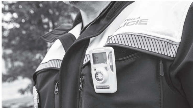
Strážníci Městské policie Varnsdorf získali nové vybavení

V celkem 5ti oblastech (podpora pořízení nové cisternové automobilové stříkačky, podpora výstavby nebo rekonstrukce požárních zbrojnic a nákupu nového dopravního automobilu nebo požárního přívěsu pro hašení, podpora spolků a veřejně prospěšných organizací působících na poli požární ochrany, ochrany obyvatelstva a ostatních složek IZS, podpora obecní nebo městské policie a vybavení jednotek Sborů dobrovolných hasičů (SDH) obcí osobními ochrannými prostředky a věcnými prostředky požární ochrany) se mohli hlásit zájemci o dotace až do výše 1,5 milionu korun u pořízení nové cisterny a desítek