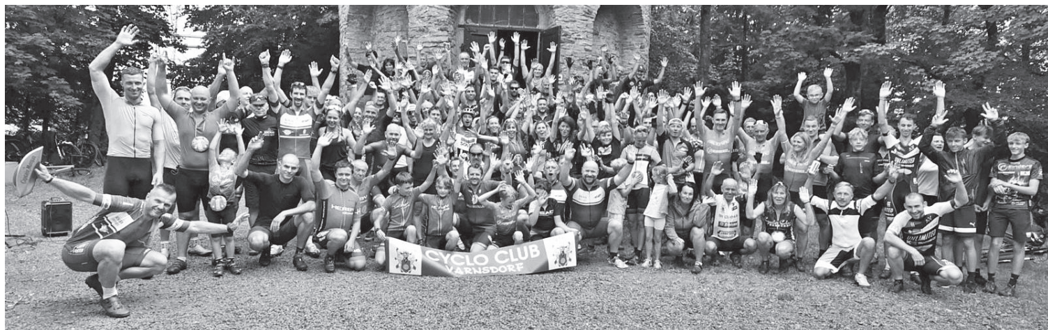
Společně foto všech závodníků na vrcholu Jedlové hory

Varnsdorf ■ V neděli 11. srpna proběhl ve Varnsdorfu již 26. ročník tradičního závodu horských kol pod hlavičkou CC Varnsdorf.