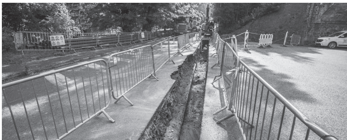
Oprava plynovodu si vyžádala uzavírku části Západní ulice

Rekonstrukce plynovodu se později dotkne i dalších ulic ve Varnsdorfu. Důvodem je špatný stav potrubí. „Část plynovodního potrubí v ulicích Mladoboleslavská a Západní se svým stavem přiblížila ke konci životnosti. Abychom i nadále zajistili bezpečné a spolehlivé dodávky plynu pro obyvatele Varnsdorfu, jsme nuceni část potrubí vyměnit. Jde o zhruba 300 metrů plynovodu. Odhadujeme, že nám práce zabere čas do konce srpna. Už v polovině července začaly i navazující práce na modernizaci potrubí v ulici Žitavská. Zároveň plánujeme na přelomu července a srpna výměnu potrubí v části ulic Střední, Melantrichova a Kmochova. Veškeré práce by měly být ukonče-