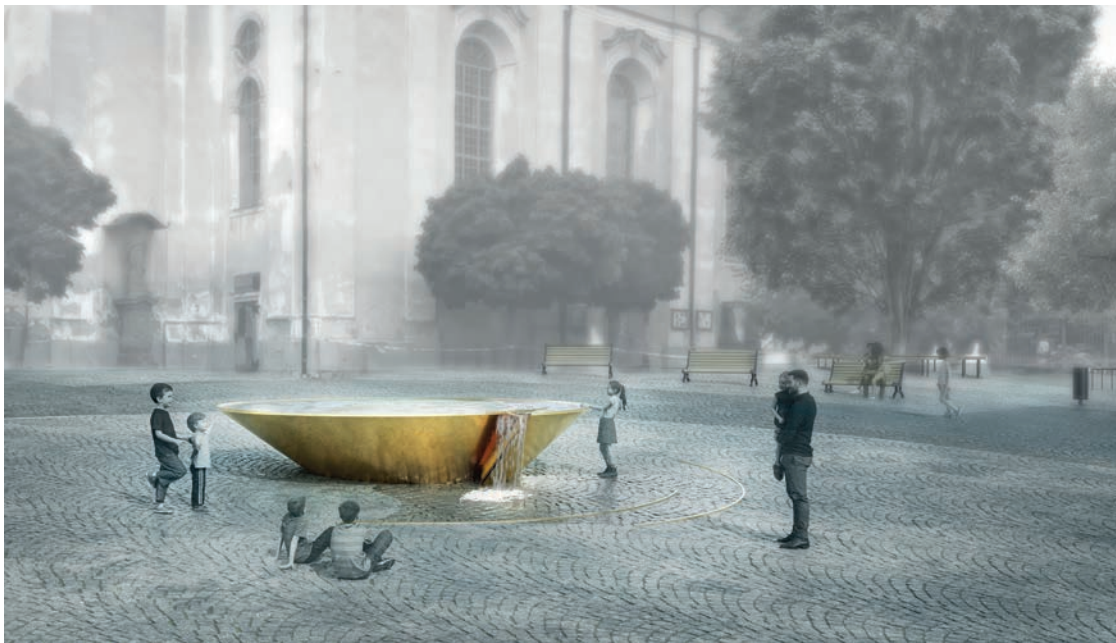
Kašna bude nabízet několik režimů. V letních měsících bude nabízet tzv. mlhoviště; vizualizace: Eliška a Ondřej Bušovi

Vítězný návrh oslovil porotu především svým současným výtvarným a estetickým pojetím