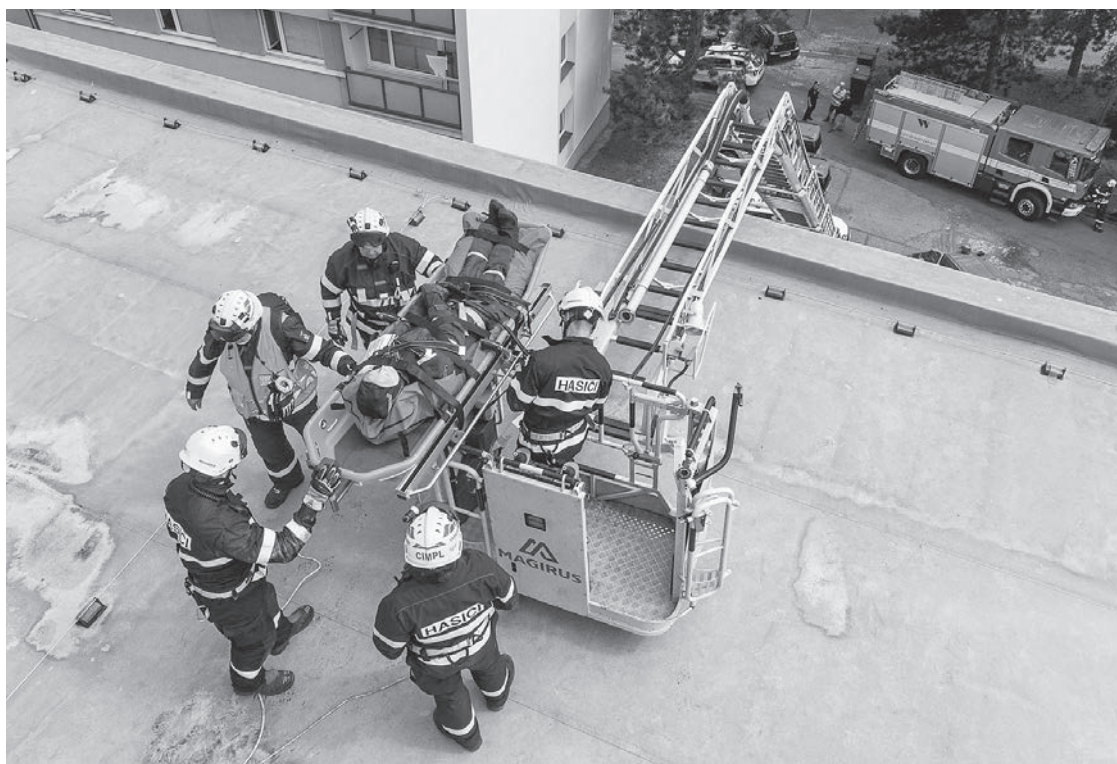
Hasiči trénovali záchranu osob ze střechy panelového domu

ky – varnsdorfská profesionální a dobrovolné z Varnsdorfu a Rumburku – byly společně se státními a městskými policisty i zdravotníky vyslány v sobotu 22. června dopoledne na Studánku, kde došlo k dopravní nehodě dvou osobních vozidel nedaleko hlavní křižovatky.