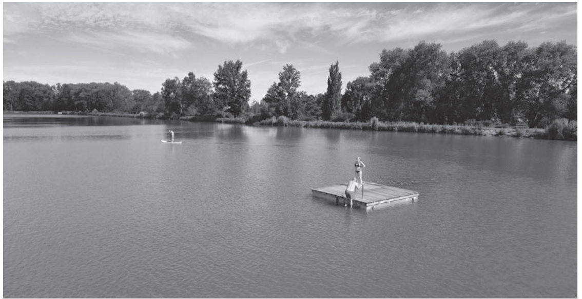
Rekreační areál Mašíňák se každý rok zvelebují

Další novinkou jsou dva pozinkované pontony s přírodní dřevěnou palubou a nerezovými schůdky. „Promptní dovoz zajis-