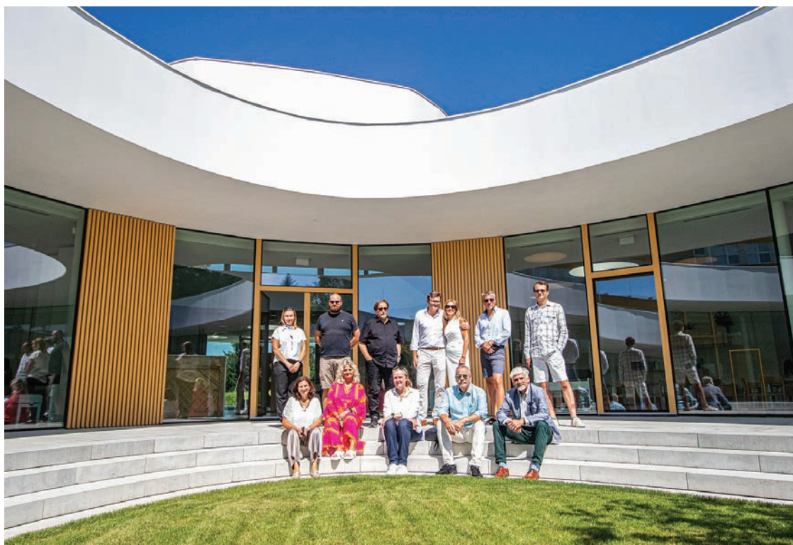
Objekt mateřské školy v Západní ulici navštívila porota soutěže Stavba roku

Nominace budou představeny na slavnostním nominačním večeru 2. září 2024 v Dopravní hale v Národním technickém muzeu v Praze. Slavnostní galavečer