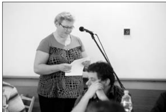
Pani Staničková vyprávěla přítomným o chování člena zastupitelstva.