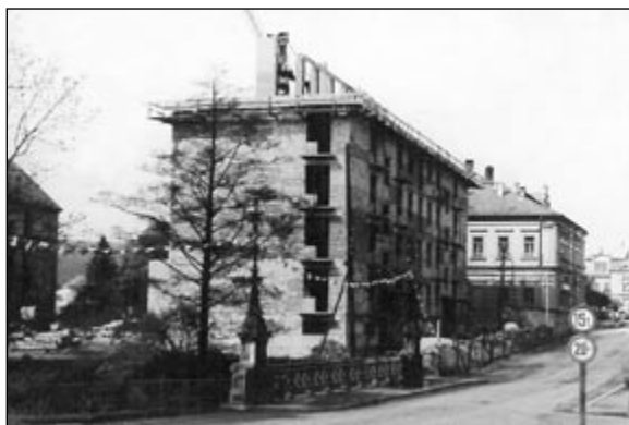
Hrubá stavba členské samosprávy 2, Varnsdorf, Legii 2543-2544.

č. 27/1959 Sb. o družstevní bytové výstavbě, který umožňoval vznik stavebních bytových družstev.