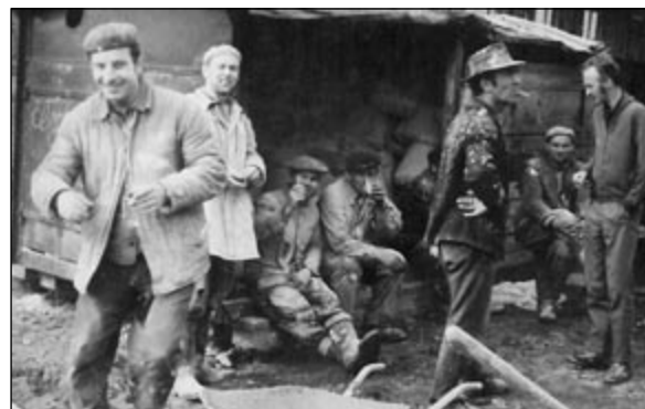
Z výstavby členské samosprávy 1, Varnsdorf, ul. 5. května 2597-2600.

soúčasného počtu 3 234 bytů a 81 samospráv. Dnes působí ve Varnsdorfu, Rumburku, Jiřikově, Šluknově, Velkém Šenově, Vilémově, Dolní Poustevně, Chřibské a Krásné Lípě.