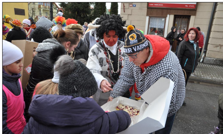
Zastávka na koláč jen co jsme vyšli