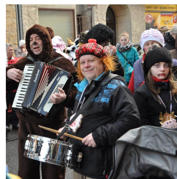
Jedlo se, pilo se, zpívalo se pračlověka