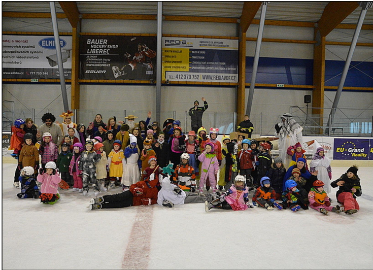
Karneval na ledě přilákal tradičně plno dětí s rodiči

Více jak 70 dětí a dospělých, z toho přes sedesát v maskách, přilákali organizátoři v neděli 26. února na zimní stadion na karnevalové pokračování úspěšného masopustu. Po rozbruslení a zahřátí přišla na řadu první soutěžní disciplína a tou byl slalom jednotlivců mezi gumovými překážkami. Slalom, který zejména těm mladším již tak činil značné problémy, byl zkomplikovaný ještě převozem tenisového míčku a to u starších dětí na raketě liného tenisu a u mladších v misce.