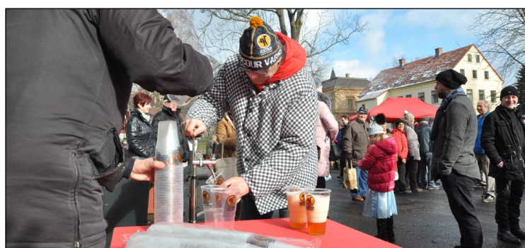
Povedlo se, sud naražen, čepujeme