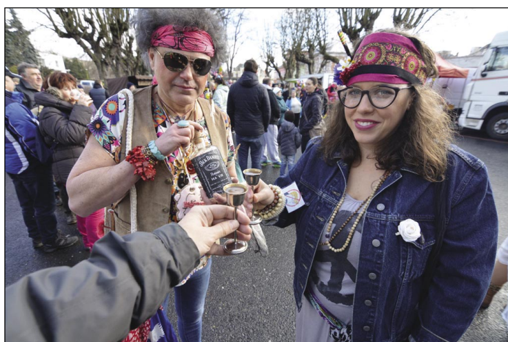
Nechyběli ani otužilci vyznávající hippies