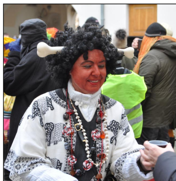
V průvodu jsme mohli spatřit