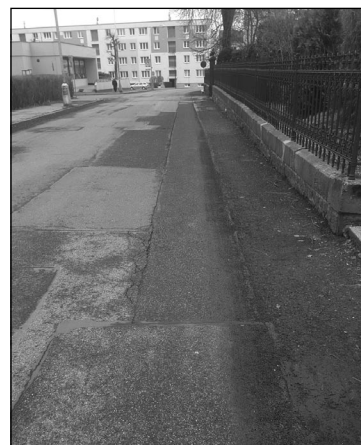
Část opravené komunikace na ulici Legii ve Varnsdorfu