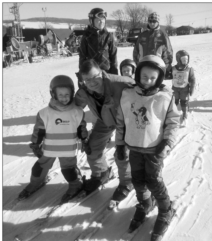
A už zase jezdíme, musíme trénovat