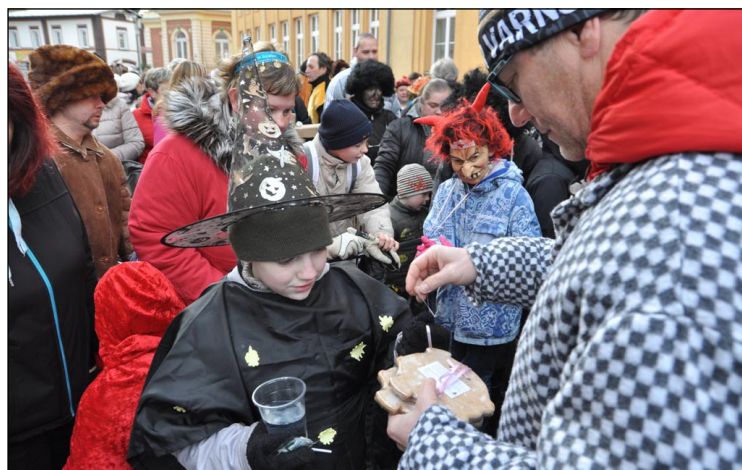
O pár desítek metrů dále rozdávání perníčků