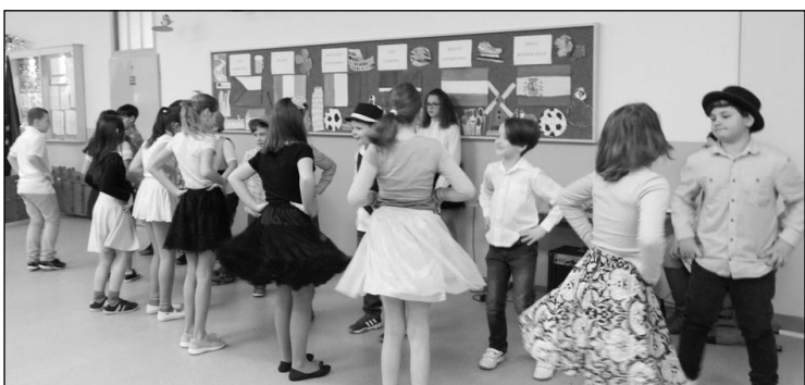
Studenti se uvedli tanečním vystoupením; foto ZŠ Edisonova

Ladislava Ondráčková, ředitelka ZŠ Edisonova