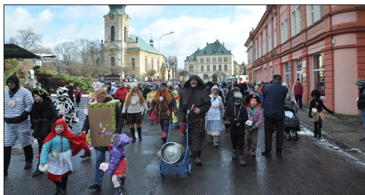
Blížíme se do cíle, kde se narazí tradiční sud