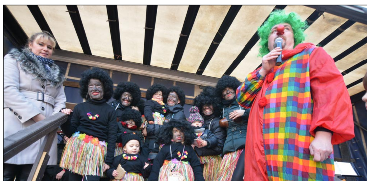
Vyhlášení nejlepších masek