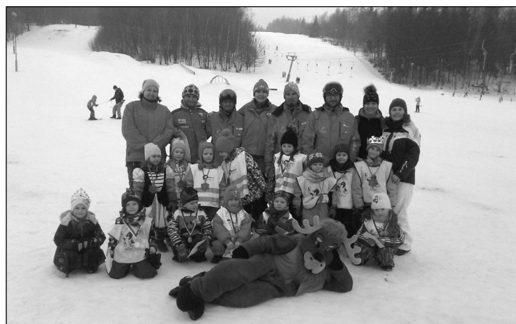
Společná fotka celého oddílu se Sobikem Timem

Text a foto Světluše Adámková, P. Richterová