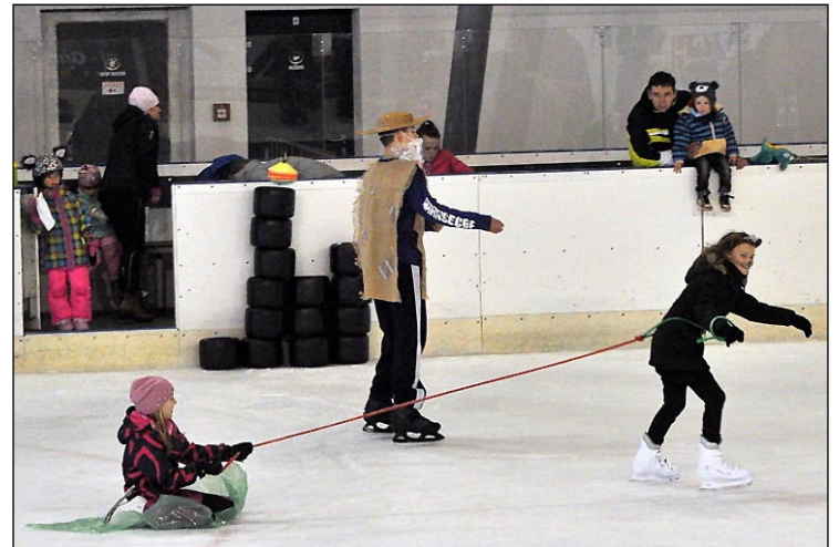
Letošní novinka bylo tahání nákladu na pytlí

bylo možné rozdat zbytek sladkých odměn, během následného volného bruslení se našla ještě chvíle času zejména pro ty nejmenší, kteří soutěžili ve středu stadionu v lovení rybiček na udici. S moderátorem a zvukařem Jirkou, akčními organizátory Janou, Stáňou, Pepou a Jardou a nezbytnou pracovní četou tvořenou šesti mladými hasiči, tak děti prožily téměř dvě hodiny aktivní a veselé zábavy a zároveň tím ukončily letošní městský masopust. JS