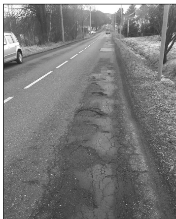
Tankodrom na ulici Plzeňská, která je v držení Správy a údržby silnic Ústeckého kraje