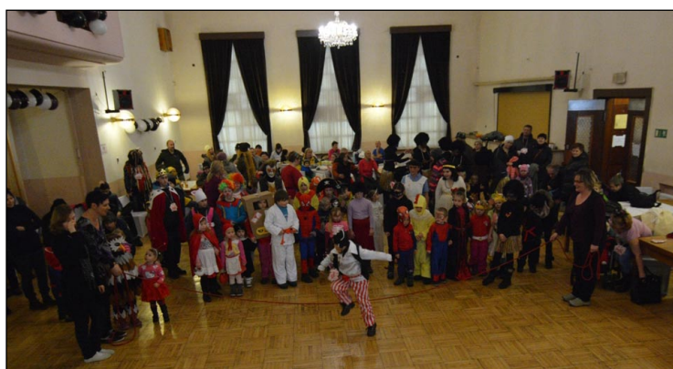
Střelnice praskala ve švech, děti si užívaly jednu soutěž za druhou